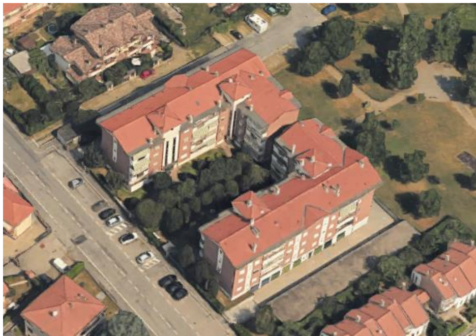
via Olona, civ. 31

Convenzione di cessione aree in diritto di superficie ai sensi dell'art. 35 della Legge 22/10/1971 n. 865, Rep. 64726/5298 a rogito Carlo Corso in data 25/11/1993