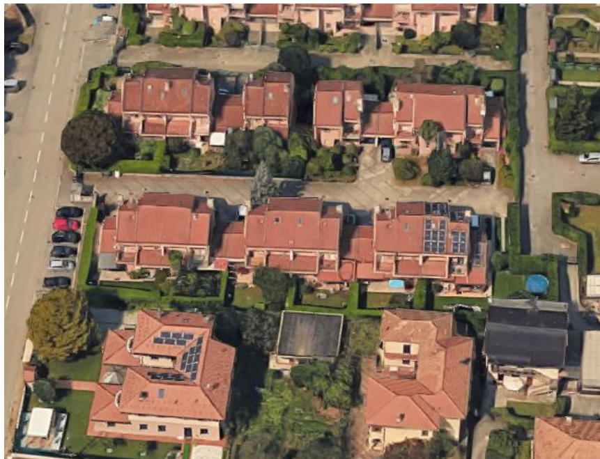
Via P. Sottocorno civ. 30