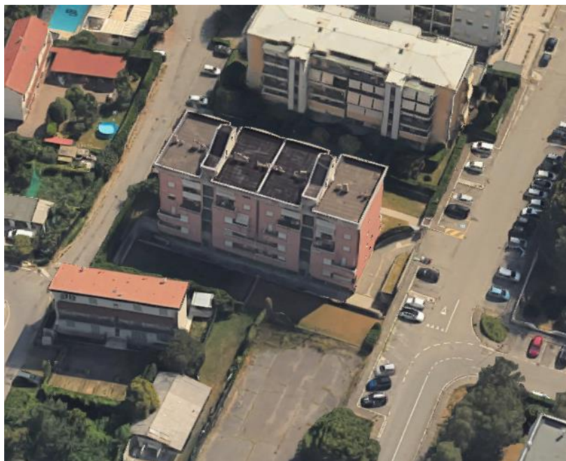
Via S. ALLENDE civ. 1 B