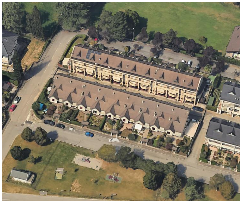
Via A. Scarlatti civ. 1 a 17

Convenzione di cessione aree in diritto di proprietà ai sensi dell'art. 35 della Legge 22/10/1971 n. 865, Rep. 37089/7932 a rogito Mario Lainati in data 30/05/1990