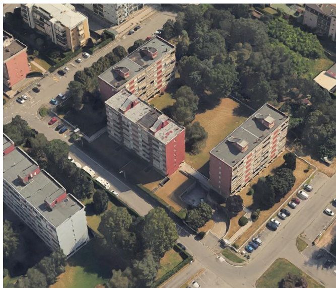
Via S. ALLENDE civ. 1 – 3 - 5

Convenzione di cessione aree in diritto di superficie ai sensi dell'art. 35 della Legge 22/10/1971 n. 865, Rep. 12968/1089 a rogito notaio Aldo Graffeo in data 30/03/1984