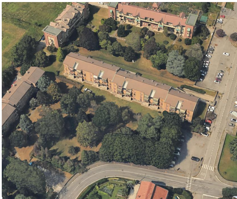
Via C. FACCHINETTI civ. 1

Convenzione di cessione aree in diritto di superficie ai sensi dell'art. 35 della Legge 22/10/1971 n. 865, Rep. 83157/9501 a rogito notaio Riccardo Morganti in data 21/10/1983