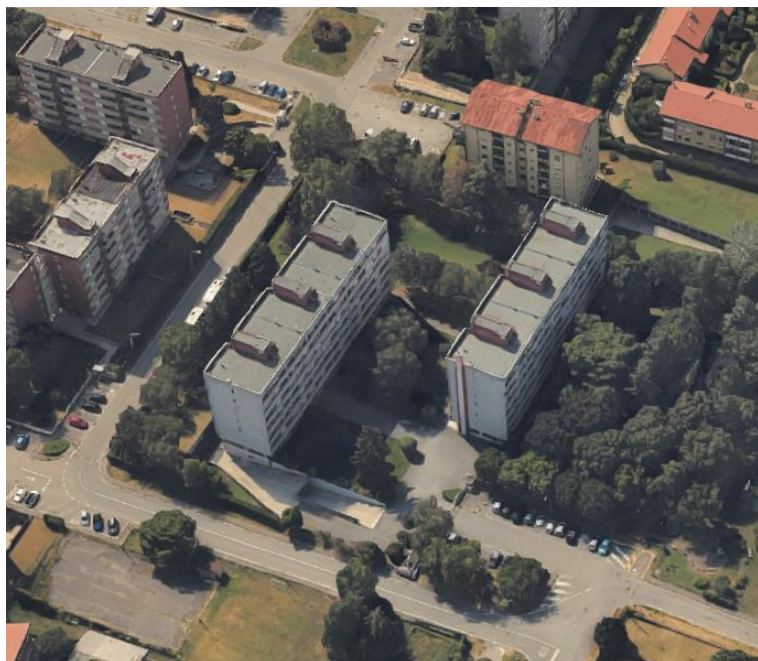
Via Puglia civ. 14 – 16

Convenzione di cessione aree in diritto di superficie ai sensi dell'art. 35 della Legge 22/10/1971 n. 865, Rep. 120110/4789 a rogito notaio Nerio Visentini coadiutore di Biagio Favuzza in data 07/07/1972 e modifica Rep. 66861/12978 a rogito notaio Aldo Graffeo in data 20/12/1996